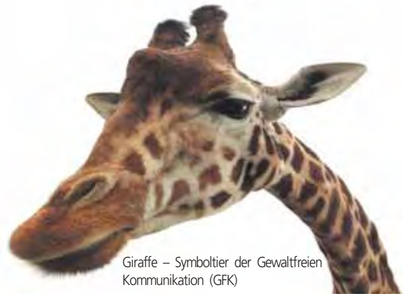
Giraffe – Symboltier der Gewaltfreien Kommunikation (GfK)