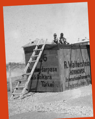
Umzugskiste Familie Reuter

Im Anschluss sind die Gäste zu einem Ausstellungsrundgang in der Steinwache eingeladen.