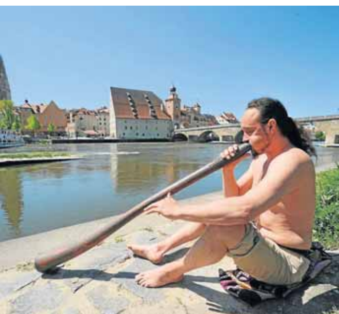
Das Didgeridoo, ursprüngliches Instrument der australischen Ureinwohner, erfreut sich auch in Deutschland wachsender Beliebtheit – nicht zuletzt als Mittel zur Entspannung.

..... 14./15. August (Sa/So), 9.30 bis 16.30 Uhr, Hansastr. 2-4, Kurs-Nr. 01-83121, weitere Informationen unter Tel. 50-2 24 35.