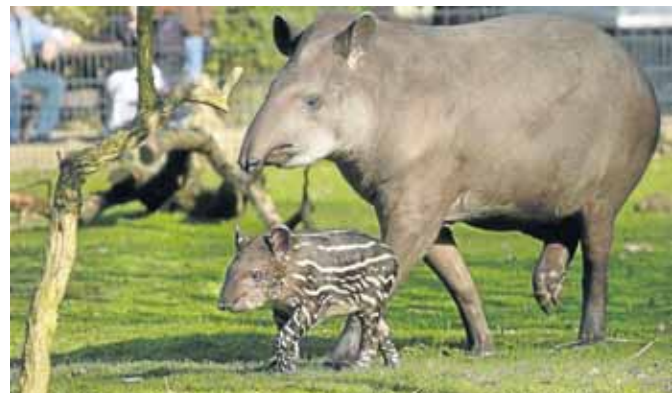
Tapir-Nachwuchs im Zoo Dortmund.

die bereits Erlerntes noch einmal kurz auffrischen, begeistern die Lernenden. Auch Informationen zur Kultur und Gesundheit sowie Small Talk und individuelles Lernen gehören zum Kurspaket. Ab 10.07. (2 x Sa), 9.30 bis 15.30 Uhr, Hansastr. 2-4, Verant.-Nr. 01-33207, weitere Informationen unter Tel. 50-2 74 71.