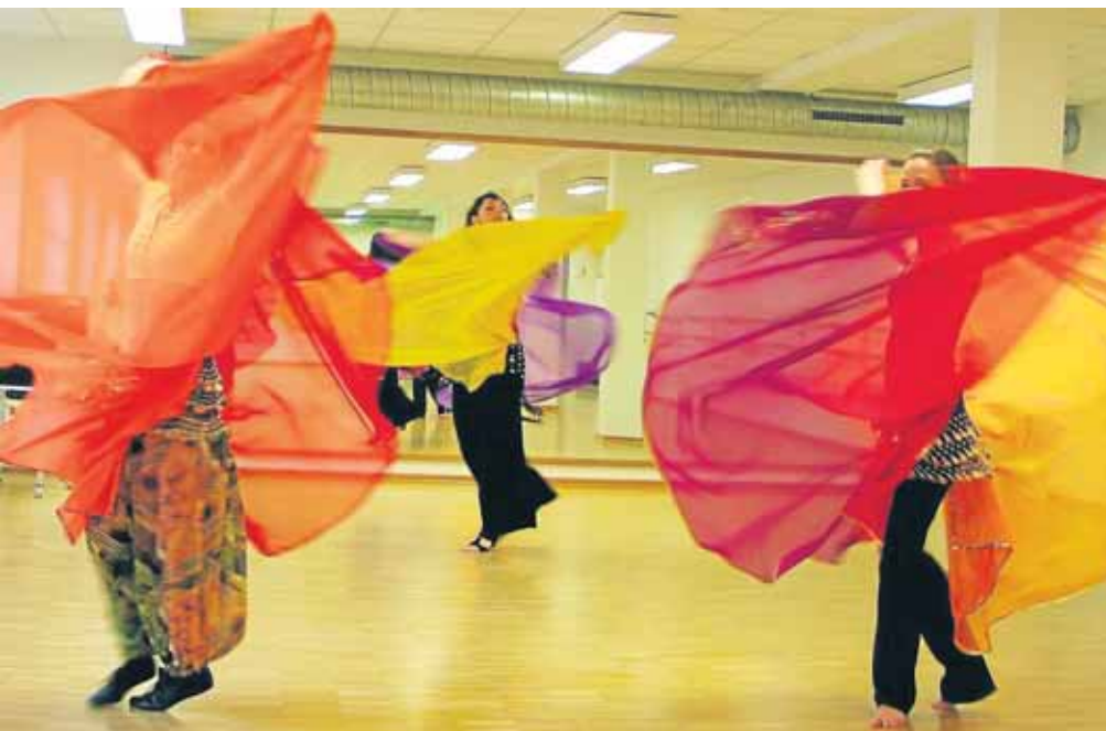
Im Farbenrausch: Beim Doppelschleiertanz lassen die Teilnehmerinnen die bunten Tücher fliegen. Es fließt aber auch Schweiß.