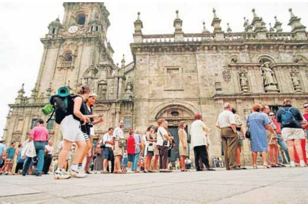
Wer auf dem Jakobsweg bis nach Santiago di Compostella pilgern möchte, sollte zumindest einige Brocken Spanisch beherrschen, die man sich bei den Schnuppertagen aneignen kann.