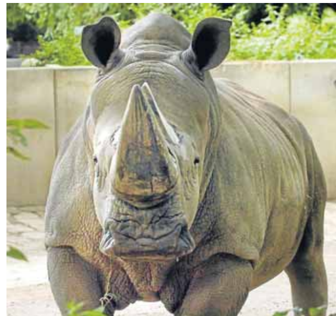
Der Workshop „Tierische Aufnahmen“ wird in Kooperation mit dem Zoo Dortmund durchgeführt.

..... 17. Juli (Sa), 10 bis 17 Uhr, Kreativzentrum, Kurs-Nr. 01-75802, Infos unter Tel. 50-2 47 17.