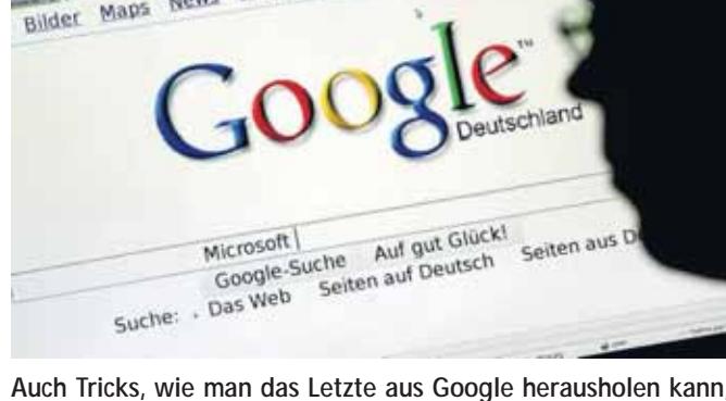
Auch Tricks, wie man das Letzte aus Google herausholen kann, vermittelt das Seminar am 3. Juli.

In diesem Kurs soll anhand der Suchmaschine Google gezeigt werden, wie man im WWW Informationen aller Art findet. Außerdem wird gezeigt, wie man mit Tuning-Tricks aus Google das Letzte herausholen kann. Die Teilnehmer lernen Web-Seiten, Bilder, News, Nachrichten der Newsgroups und vieles andere zu finden, Google als Übersetzer oder Wörterbuch zu benutzen. Gezeigt wird auch, wie man zum Beispiel nach Personen sucht, Telefonnummern ermittelt und sich eine Reiseroute ausrechnen lässt. EDV-Grundkenntnisse sind wünschenswert. 3. Juli (Sa), 9 bis 16 Uhr, Hansastr. 2-4, Kurs-Nr. 01-25616, Infos unter Tel. 50-2 47 20.