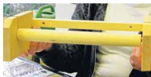
Kleinmöbel wie diese Ablage oder auch eine Gartenbank können in einer Woche fertig sein.

Unter fachkundiger Anleitung können dann Kleinmöbel, Kunstobjekte oder Kinderspielzeug hergestellt wer-