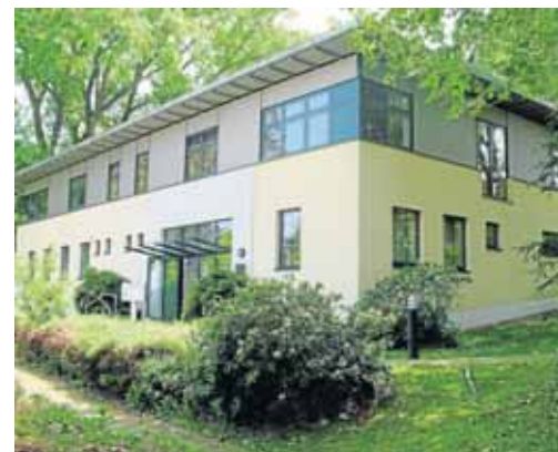
Im Jahre 1996 begann Umbau der Gebäude der früheren Zeche Dorstfeld 2/3 (li.) – und so sieht heute dieses Hauptgebäude des Creativzentrums an der Oberbank in Dorstfeld aus.