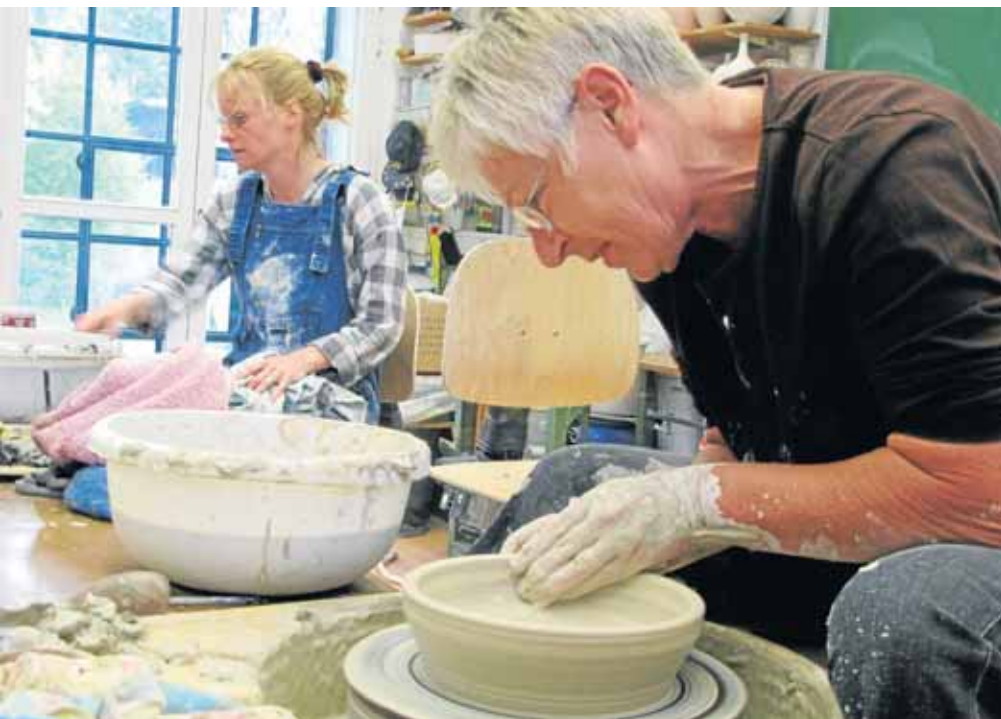
Hingebungsvoll in die Arbeit vertieft, die so letztlich auch Entspannung vermittelt.