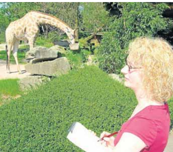
Zeichenstudien im Dortmunder Zoo wie hier bei den Giraffen stehen am zweiten Kurstag auf dem Programm.

..... 19. bis 23. Juli (Mo-Fr), 10 bis 17 Uhr, Creativzentrum, Kurs-Nr. 01-72030, Informationen unter Tel. 50-2 47 17.