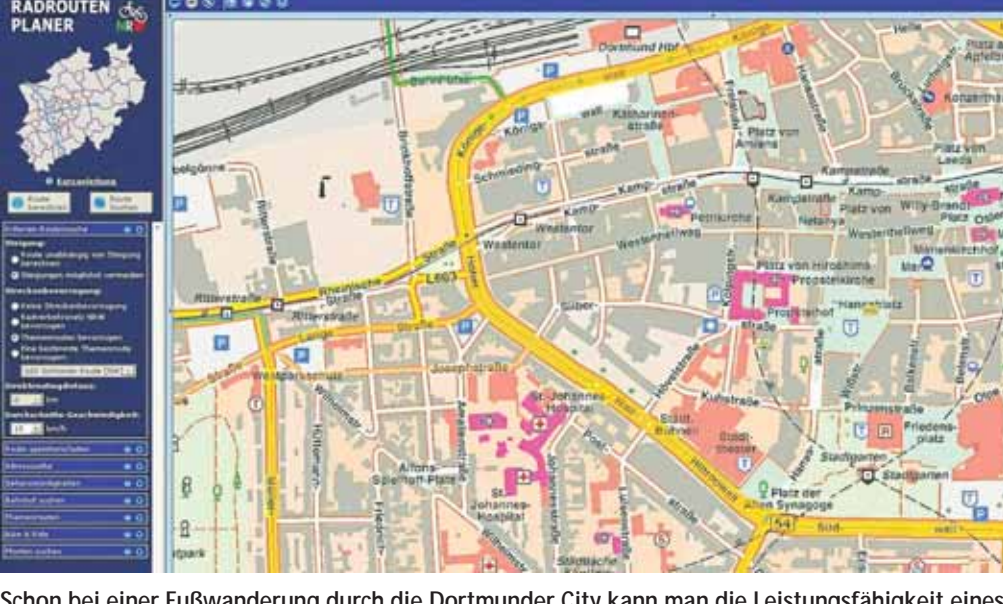
Schon bei einer Fußwanderung durch die Dortmunder City kann man die Leistungsfähigkeit eines GPS-Gerätes testen.