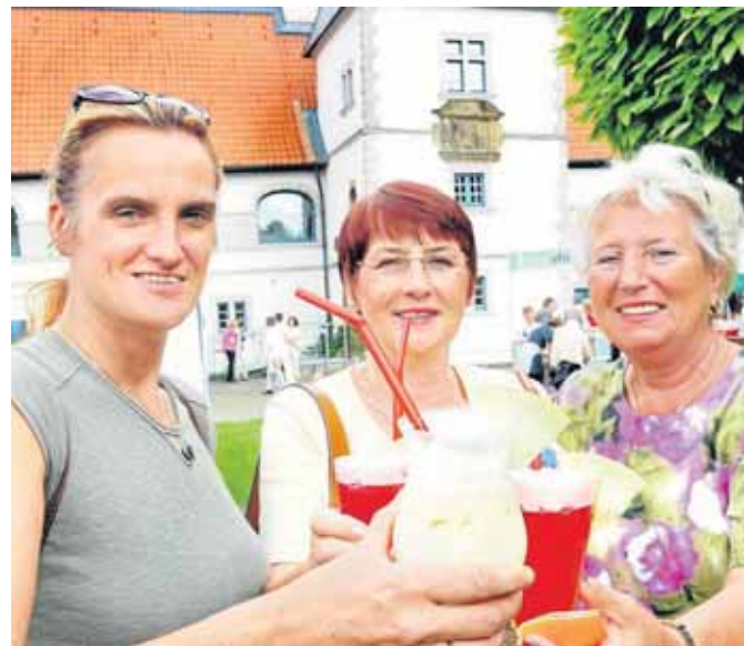
Beim Sprachen-Cocktail gibt es immer auch richtige Cocktails – mit und ohne Alkohol, gezaubert von einem Barkeeper.

Für Sprachinteressierte mit Vorkenntnissen gibt es in dieser Zeit auch noch Vorträge, die landeskundliches Wissen vermitteln in der jeweiligen Fremdsprache. So geht es um „Englischen Humor“ (26.8., 16 Uhr) und eine Schnupperstunde mit Vortrag wird zu Australien angeboten (26.8., 17.45 Uhr). „Bienvenidos a Asturias!“ und „Viaggio in Sardegna“ heißen die Vorträge in Spanisch und Italienisch, die am 26. August um 19.30 Uhr starten und von Muttersprachlern gehalten werden. ■ br