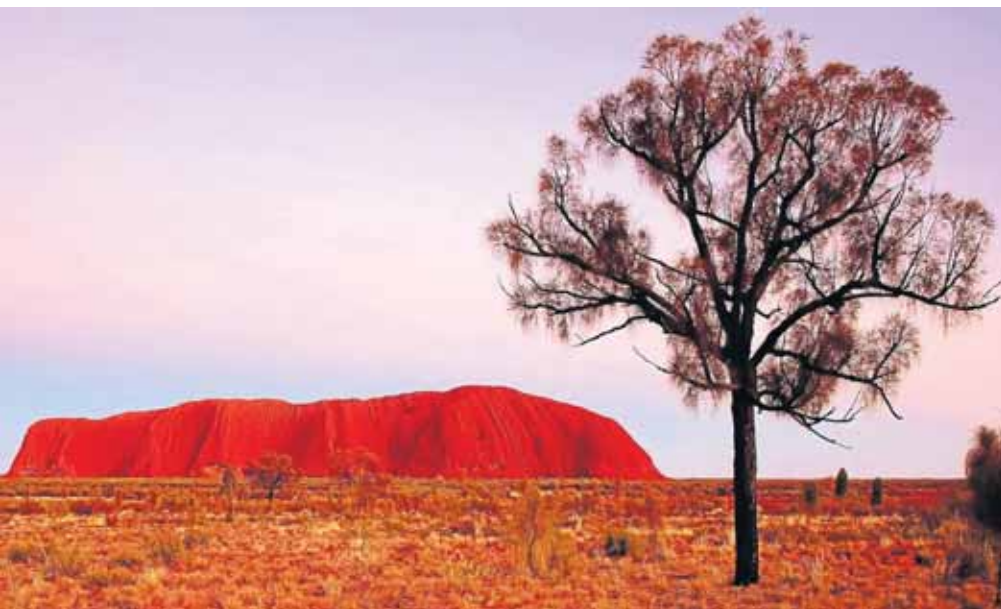
Eines der bekanntesten Wahrzeichen des fünften Kontinents: Der riesige Sandstein Ayers Rock bzw. Uluru, in der Sprache der Aborigines, in der zentralaustralischen Wüste.