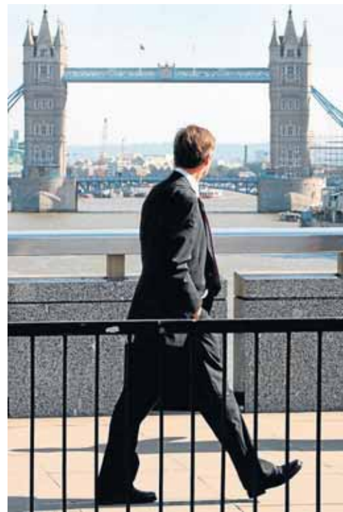
Wer in London Geschäfte machen will, sollte auch mit britischen Traditionen vertraut sein.

..... 05.07.-09.07. (Mo-Fr), 9.30 bis 15.30 Uhr, Hansastr. 2-4, Veranst.-Nr.: 01-32513 (A2) + Veranst.-Nr. 01-33102 (B1) + Veranst.-Nr. 01-35315 (B1/B2); 23.08.-27.08. (Mo-Fr), 9.30 bis 15.30 Uhr, Hansastr. 2-4, Veranst.-Nr. 01-34002 (B2), Informationen unter Tel. 50-2 74 71.