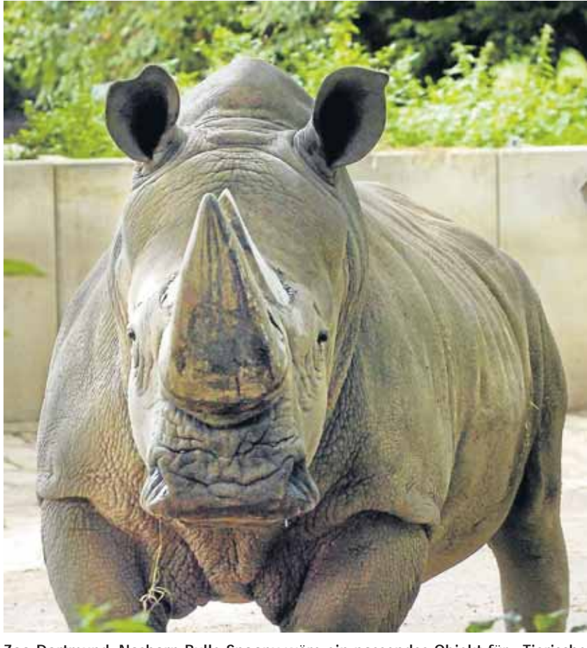
Zoo Dortmund: Nashorn-Bulle Snoopy wäre ein passendes Objekt für „Tierische Skizzen“ oder „Tierische Aufnahmen“.

Selbst die Kreativen werken, töpfeln und fotografieren im Sommer nicht nur in den – übrigens erstklassig ausgestatteten – Ateliers und Werkstätten, sondern drängen ebenfalls an die frische Luft: „Mal an der Staffelei, Mal über Feld und Flur und Mal am Kanal“ ist der längliche Titel eines kurzweiligen Malkurses. Draußen gezeichnet wird auch: „Tierische Skizzen“ im Zoo Dortmund. Und was den Zeichnerinnen recht ist, ist den Fotografen billig: Sie machen am gleichen Ort „Tierische Aufnahmen“. Kurzum: Die Sommer-VHS 2010 verspricht auch tierischen Lernspaß. ■ bot